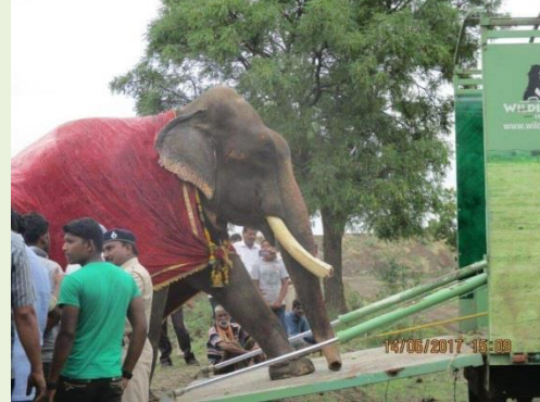
上圖：Gajraj 被鍊乞討受虐 51 年