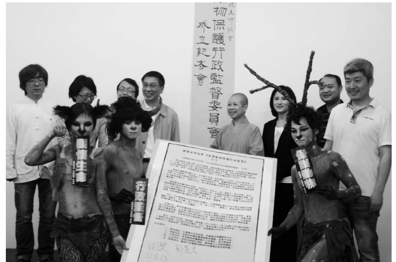
2012 年 3 月 18 日《動物保護行政監督委員會》假臺北市 NGO 會館演講廳舉辦成立記者及《動物保護行政監督論壇》第一場：「從行政監督談動物保護法令的落實」。

有鑑於台灣動物保護問題層出不窮，相關主管機關態度消極，許多無辜的生命因此而被剝奪。為了能有效監督政府落實動物保護法規，2012 年 1 月，在關懷生命協會邁向二十週年之際，協會邀集不同領域學者、公民團體代表與宗教等組織成立了「動物保護行政監督委員會」。以