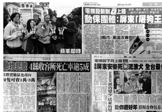
▲2017年1月3日日本會前往監察院門口，召開「屠狗之王」記者會，譴責無心改善縣市：屏東、彰化、澎湖與南投，並函送監察院處理，這場記者會引發媒體廣大迴響。

上面所述，當然還不包含經濟動物、野生動物與實驗動物。而展望未來，期待台灣有更多的「動保行政監督」團體、「動保公民」投入，那麼讓「愛護動物」成為台灣人共同核心價值的夢想將不再遙不可及。