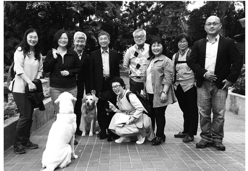
▲2018年4月15日地球日前夕，蔡英文總統在官邸接見環保團體，聽取建言。會後總統邀請大家與她領養退役導盲犬見面。

2016年5月20日，蔡英文就任中華民國第14屆總統，成為我國史上第一位女總統。而台灣也正式迎來了第三次政黨輪替，民進黨全面執政。在蔡總統就職前夕，何宗勳特別代表關懷生命協會，撰寫《動保政策建言》，提醒並