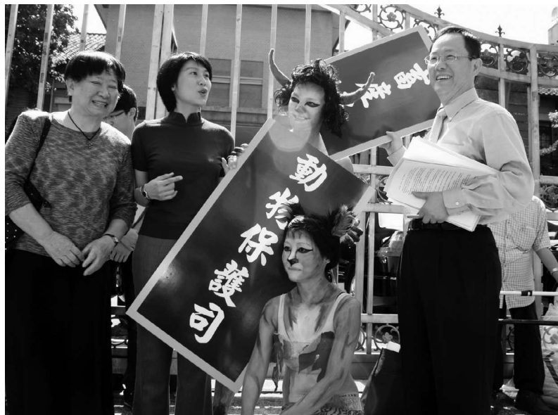
在民間團體催生獨立動保機關陷入瓶頸時，動督會在 2012 年 5 月 2 日透過倡議呼籲跨黨派委員支持，終於讓運動有突破性進展。

「動督會」成立之後第一個具體成果就是與動保團體催生了「動物保護委員會」。近幾年來，由於政府進行組織再造，農委會可望升格農業部，原本畜牧處要調整為「畜產及動物保護司」。但是將動物保護的職能放在傳統以經濟思維主導的「畜產司」之下，顯然和民間所期待的脫離