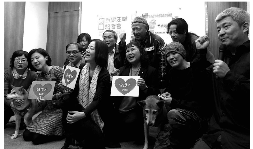
2018 年 1 月 26 日動督盟與立委陳曼麗、吳思瑤與王育敏聯合召開記者會公佈第三次全國校犬調查結果。

關懷生命協會早在 2009 年，就開始結合各大學動保社團，成立了「大學動保社團連線」。這個匯集著全台動保青年愛心與專注的平台，經過多年的努力經營，已經獲得 53 個大學動保社團加入。透過與各個社團的互動，協會才得以深入瞭解早期許多學校飼養校犬遇到的問題，並持續從案例中統整出校犬管理方法，為後來者提供經驗借鑒。