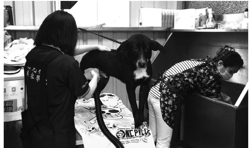
▲桃園市動物保護教育園區，志工到收容所為毛小孩洗澡。

流浪動物零撲殺政策生效後，桃園市政府積極行動，提出了「桃樂動物友善城市」的計劃。鄭文燦市長在接受媒體採訪時表示，桃園全市有超過半數的里響應了計劃，計劃培養的動保志工將近 1,207 人。