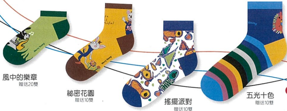
風中的樂章 贈送20雙